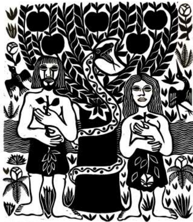
Genesis 3, 1-6

Aber die Schlange war listiger als alle Tiere auf dem Felde, die Gott der HERR gemacht hatte, und sprach zu dem Weibe: Ja, sollte Gott gesagt haben: ihr sollt nicht essen von allen Bäumen im Garten? Da sprach das Weib zu der Schlange: Wir essen von den Früchten der Bäume im Garten; aber von den Früchten des Baumes mitten im Garten hat Gott gesagt: Esset nicht davon, rühret sie auch nicht an, daß ihr nicht sterbet! Da sprach die Schlange zum Weibe: Ihr werdet keineswegs des Todes sterben, sondern Gott weiß: an dem Tage, da ihr davon esset, werden eure Augen aufgetan, und ihr werdet sein wie Gott und wissen, was gut und böse ist. Und das Weib sah, daß von dem Baum gut zu essen wäre und daß er eine Lust für die Augen wäre und verlockend, weil er klug machte. Und sie nahm von der Frucht und aß und gab ihrem Mann, der bei ihr war, auch davon, und er aß.