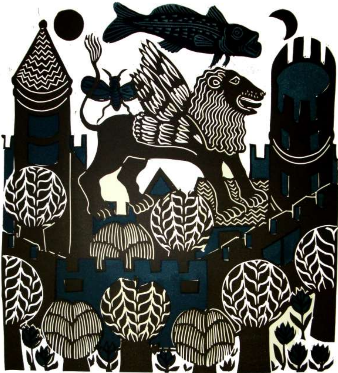
Daniel 7, 4

Das erste war wie ein Löwe und hatte Flügel wie ein Adler. Ich sah, wie ihm die Flügel genommen wurden. Und es wurde von der Erde aufgehoben und auf zwei Füße gestellt wie ein Mensch, und es wurde ihm ein menschliches Herz gegeben.